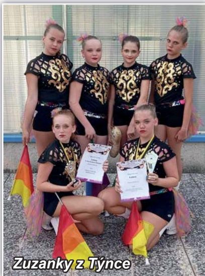
Zuzanky z Týnce