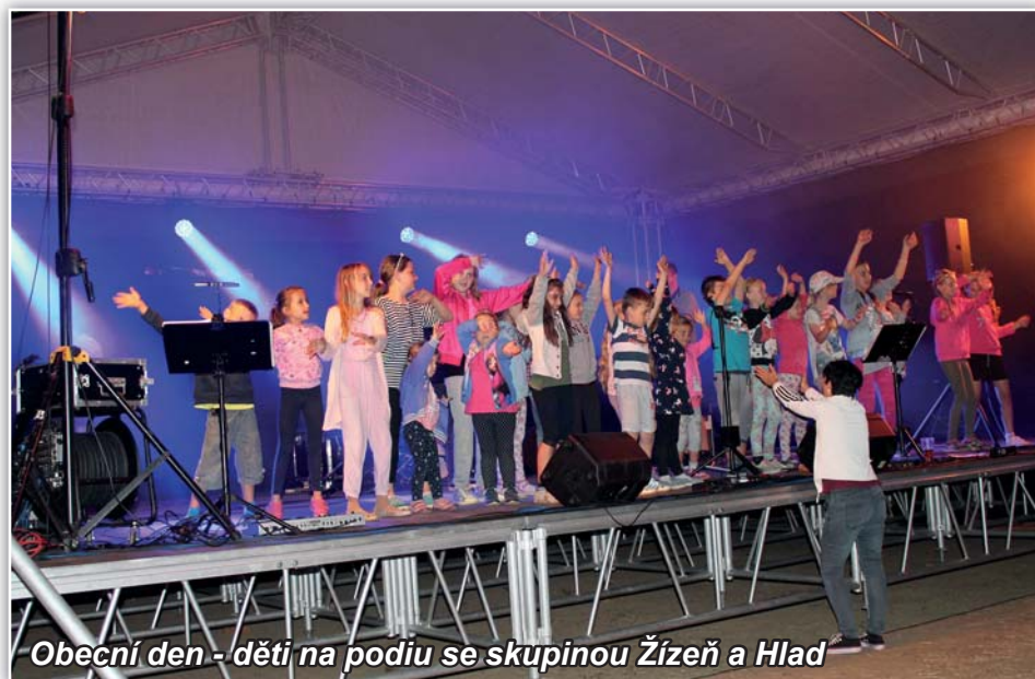
Obecní den - děti na podiu se skupinou Žízeň a Hlad