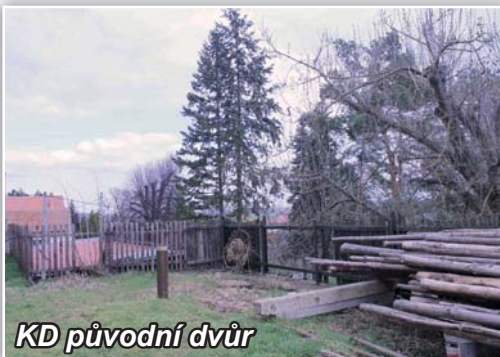
KD původní dvůr