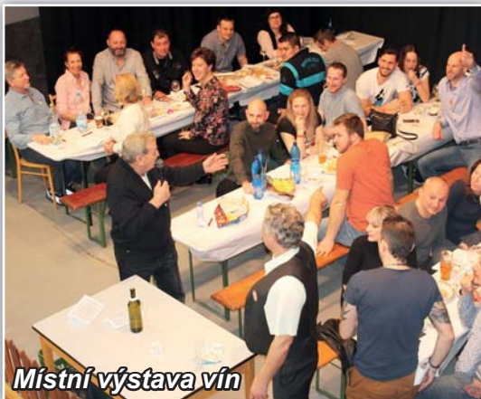
Místní výstava vín