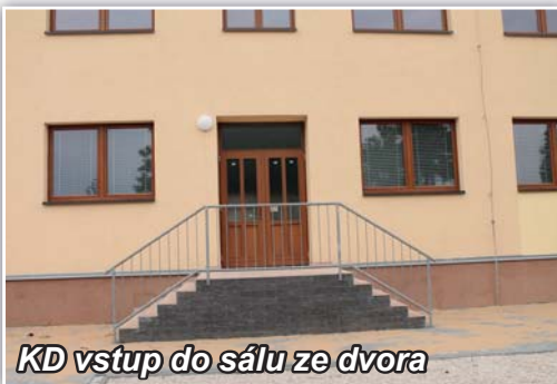
KD vstup do sálu ze dvora

Smlouvy (o poskytování právnických služeb, o spolupráci s obecní policií M.N.Ves, o přezkumu hospodaření obce, návrh kupní smlouvy při prodeji pozemků, smlouvy o dílo na stavební práce, o smlouvě budoucí pro věcné břemeno, např. pro E.ON), rozpočtová opatření. Dále žádosti o pronájem sálu nebo klubovny v kulturním domě pro rodinné oslavy, nastala nutnost prodloužení vodovodního řadu u školy na ulici Vinohradní. Projednala výroční zprávu o poskytnutých informacích dle zákona 106/1999 Sb., žádosti o povolení kácení dřevin rostoucích mimo les, zpevnění povrchu uličky na Luční (vedle bývalé Bašty), opravy v kulturním domě a úpravu jeho dvora, Směrnice o zadávání veřejných zakázek malého rozsahu (aktualizace), probíhající řešení pozemku pod kulturním domem (kulturní dům vlastní obec, pozemek je zapsán na dnes už neexistující ČSTV TJ Sokol Týnec – řeší Sokoli), aktualizace povodňového plánu.