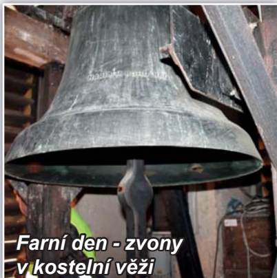
Farní den - zvony v kostelní věži