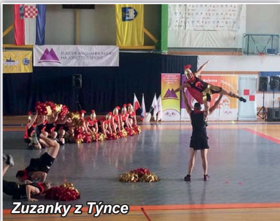
Zuzanky z Týnce