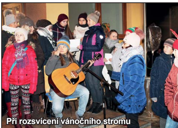
Při rozsvícení vánočního stromu