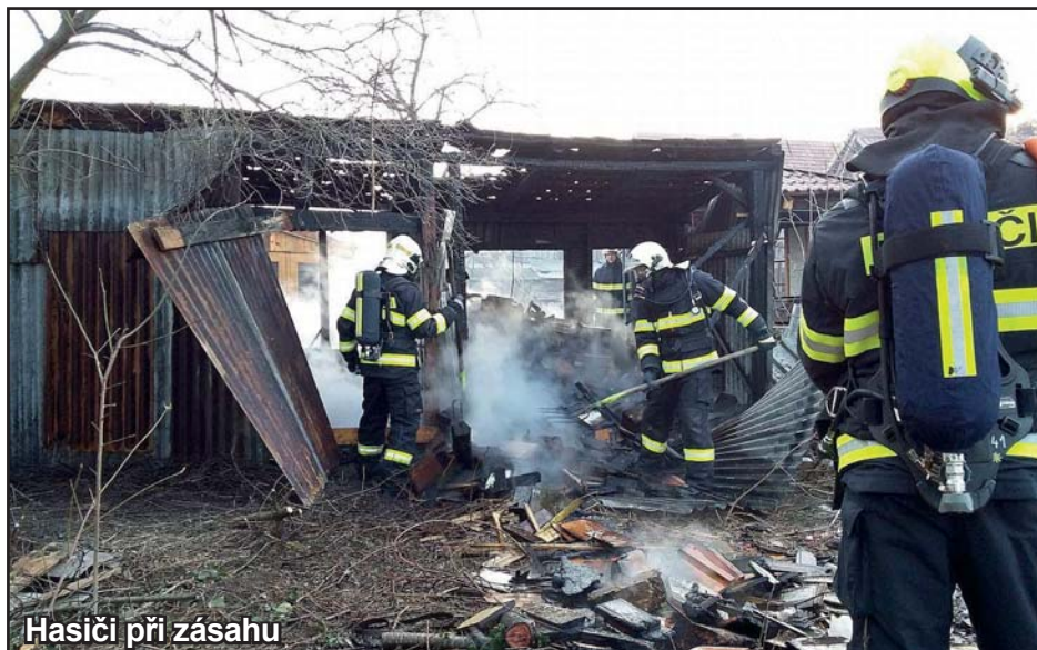
Hasiči při zásahu