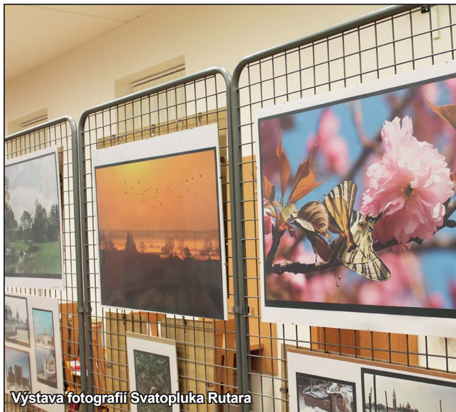
Výstava fotografií Svatopluka Rutara