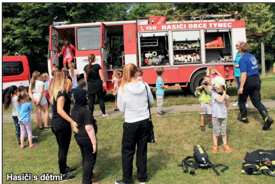
Hasiči s dětmi