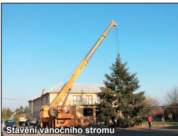
Stavění vánočního stromu