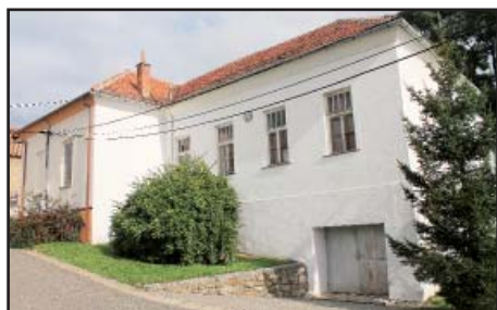
Fasáda OÚ původní

Doplnění výzbroje a výstroje hasičů (elektrocentrála, motorová pila, zásahové oděvy) - dotace JMK