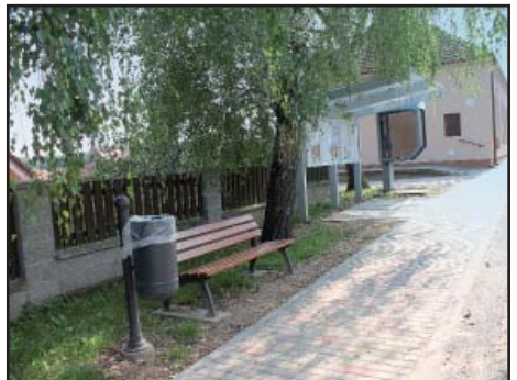
Chodník k OÚ nový