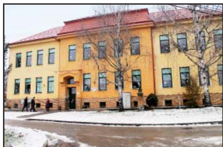
Stará fasáda na škole