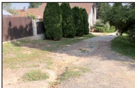
Ke Sklepům před