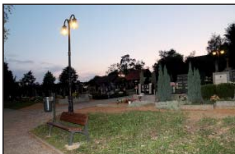
Hřbitov osvětlení, lavičky