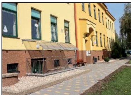
Chodník před školou