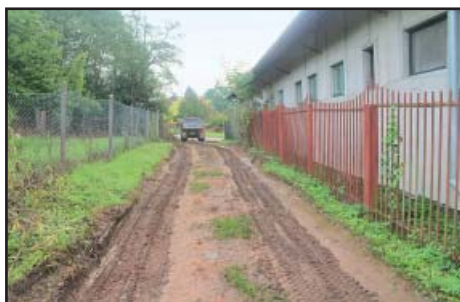
Komunikace SD stará