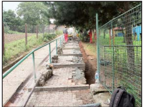
Oprava zídky ve školní zahradě