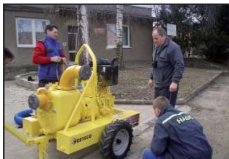
Hasiči - doplnění techniky