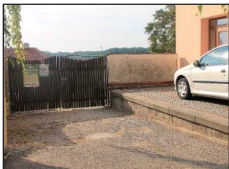
Vjezd do dvora OÚ starý