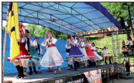
Oslava nového znaku a praporu obce