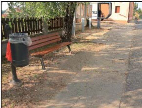
Chodník k OÚ starý