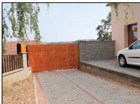
Vjezd do dvora nový