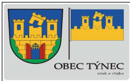
TÝNEC znak a vlajka