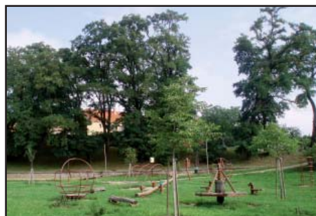
Herní prvky Hradištěk staré