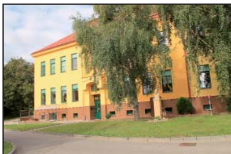
Fasáda škola nová