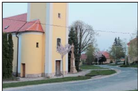
Kostel chodník starý