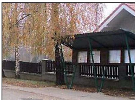
Úřední desky staré