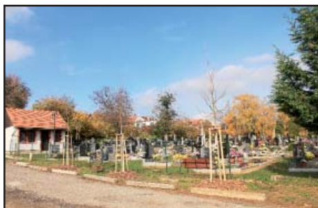
Obnova zeleně na hřbitově