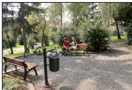
Park u kostela - chodníky, lavičky