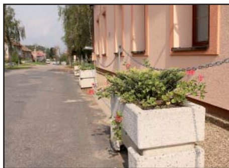
Květináče před OÚ