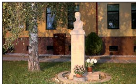
večerní osvětlení TGM