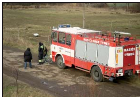
Hasičské auto u požáru