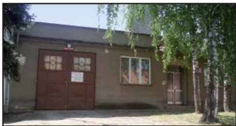
Hasičská zbrojnice před opravou