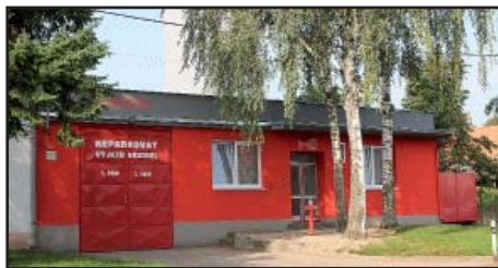
Hasičská zbrojnice po opravě