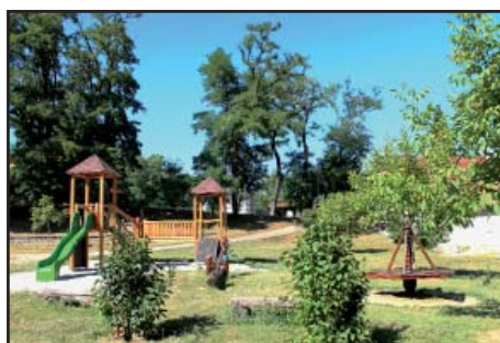
Herní prvky Hradištěk nové