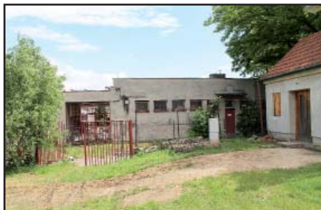
před stavbou WC