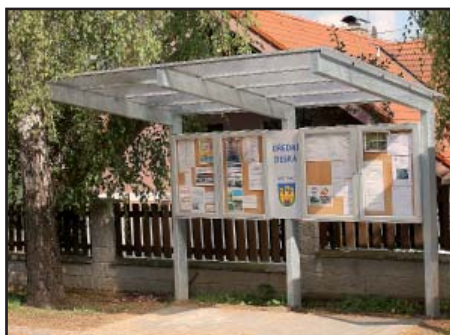
Úřední desky nové