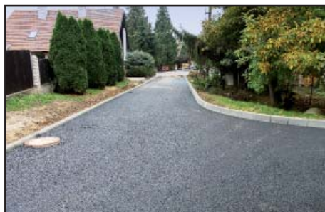
Ke Sklepům po