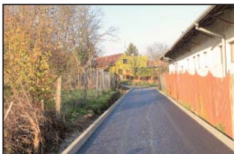
Komunikace SD nová