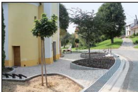
Kostel chodník nový