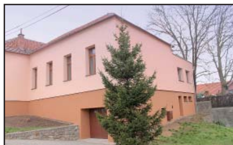
Fasáda OÚ - zateplení