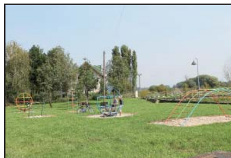
Herní prvky u Kyjovky