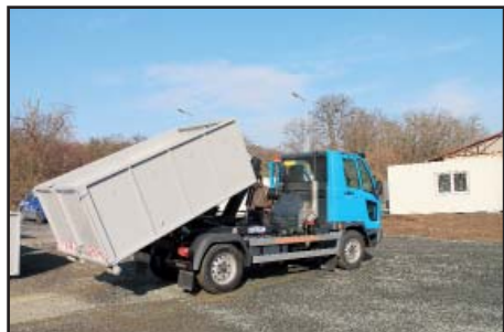
Multikára na SD