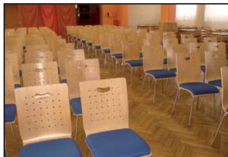
Nové židle na KD