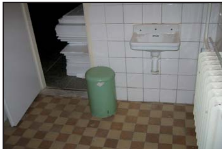
původní předsíňka WC