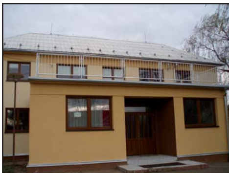
Nová fasáda a okna na KD