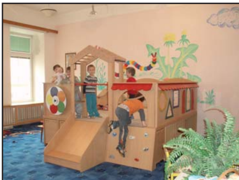
jeden z nových herních prvků v MŠ

O pracích na škole jsme vás informovali v předchozím zpravodaji.