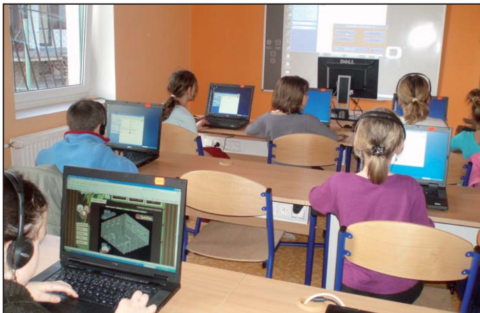
Místnost bývalé učebny PC