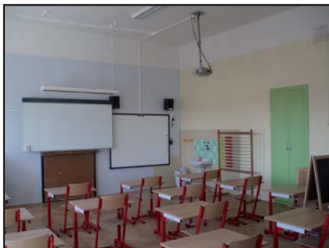
jedna z učeben ve škole

Nyní připravujeme projekt rekonstrukce obecního úřadu.