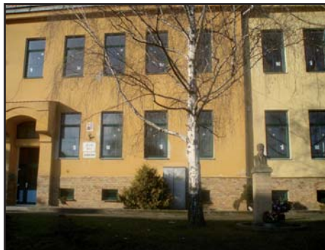
škola – nová okna