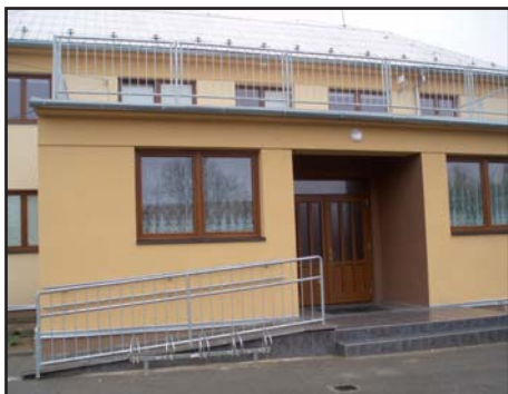
Vstupy do kulturního domu

U kostela a k Valům byly vysazeny nové stromy na místě starých pokácených kaštanů. Tento zásah byl nutný vzhledem ke stáří a vzhledu porostu. Kaštanů byly napadeny chorobou klíněnkou.