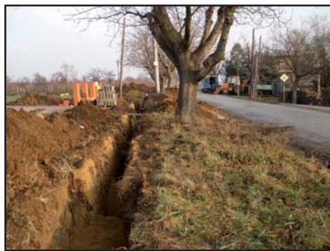
Práce na vodovodu Hlavní

Hasičům jsme koupili kabáty, obuv a radiostanici, pomohla i dotace JMK.