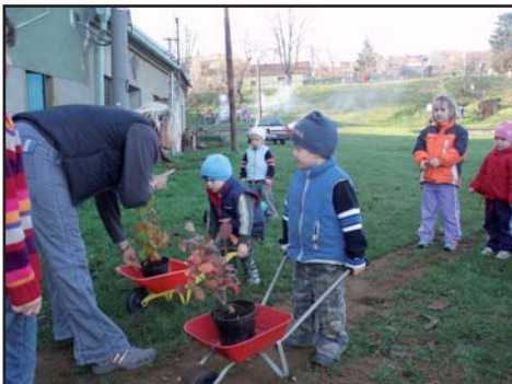
Děti na Hradištku