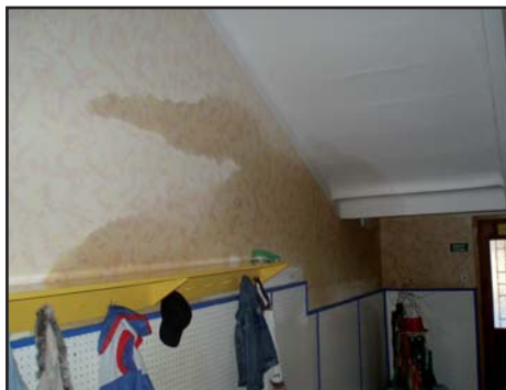
Jedna z mokrých stěn od sociálního zařízení

Po rozsáhlých přípravách byla s podporou 3 milionové dotace ze státního rozpočtu provedena stavba „Rekonstrukce ZŠ Týnec“, a to rekonstrukce komínů, výměna krovů a střechy, nová sociální zařízení a elektroinstalace v nich – všechno v silně havarijním stavu. Původní stav nevyhovoval současným předpisům a hrozilo omezení provozu školy.