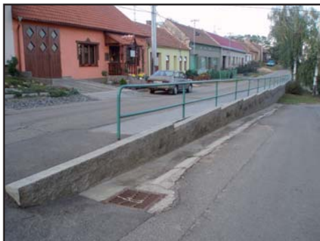
nová zídka a chodník po akci