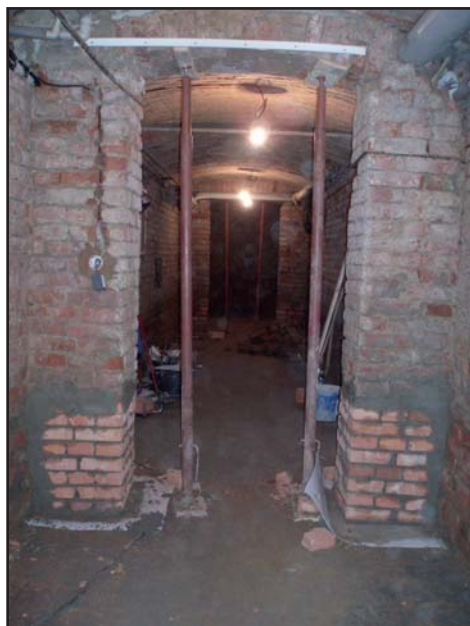
Chodba v suterénu v průběhu prací