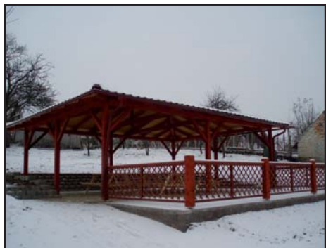
Učebna v přírodě