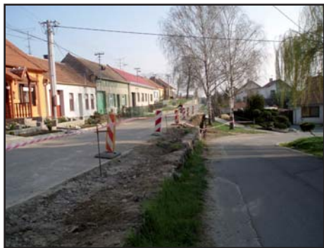
Špatná zídka a chodník před -