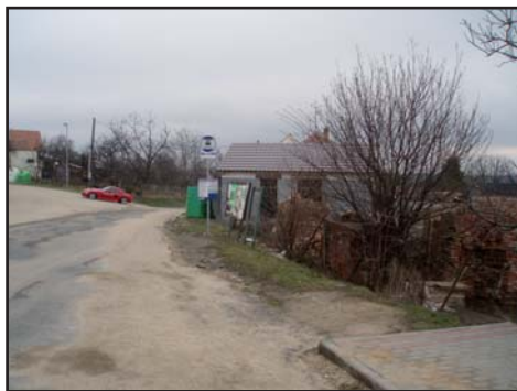
Původní místo zastávky ...

U autobusové zastávky byl vybudován chodník jako pěkné a bezpečné nástupišť autobusů.