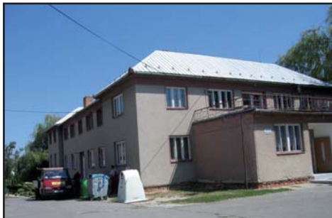
Kulturní dům před opravou

Po třech letech byla dokončena veřejná sbírka na záchranu života a zdraví malého dítěte – Sára Kališové, ve které se vybralo 1 336 697 korun, jimiž byly zaplaceny léky a zdravotní pomůcky pro tuto malou holčičku.