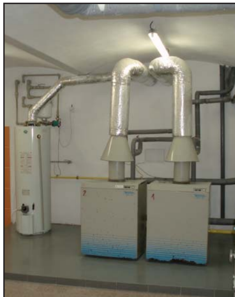
- kotelna po akci