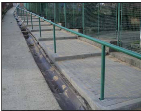
schody u školy