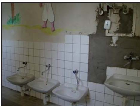
WC ve škole - původní