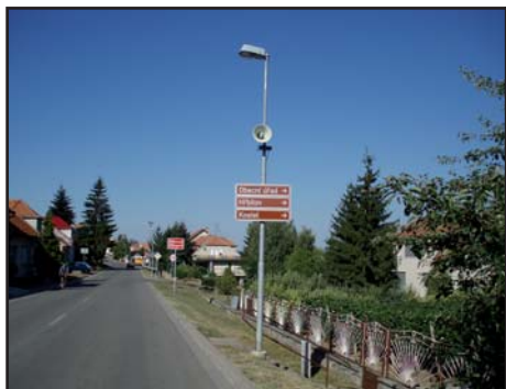
Informační značení obce