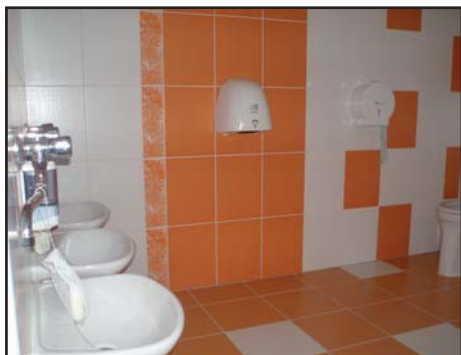
Nová WC pro děvčata..