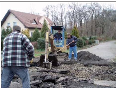
práce na mostě k hřišti