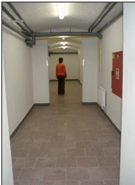
chodba po rekonstrukci