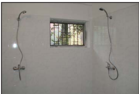
Nové sprchy v kabinách na hřišti