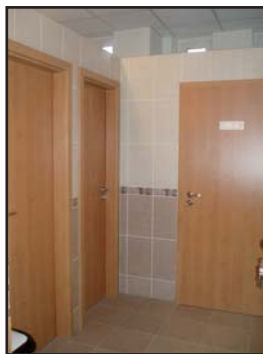
Upravená předsíňka na WC